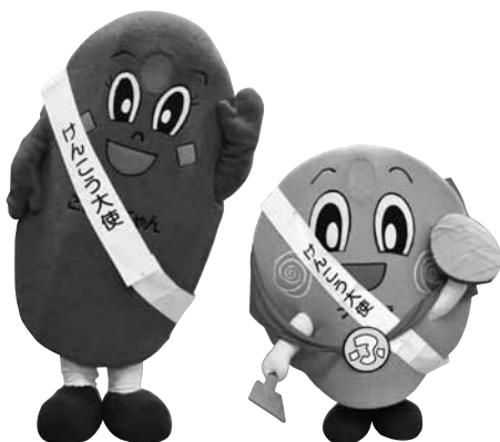
けんこう大使のこぜにちゃんとフラベス