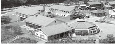
ヴィラせせらぎでリラックス