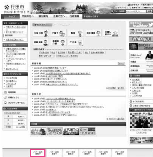
ここに広告が掲載されます

バナー広告とは、市ホームページ内に表示される有料広告で、広告主の指定するホームページにリンクするものです。 ホームページを開設している企業、事業所、自営業などを営む皆さん、月平均9万件のアクセスがある市ホームページにぜひ広告を掲載してみませんか。