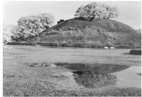
「古墳の桜」(写真) 半田充右 (南河原)