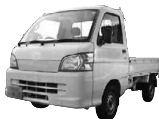
車両(トラックや軽トラックなど)