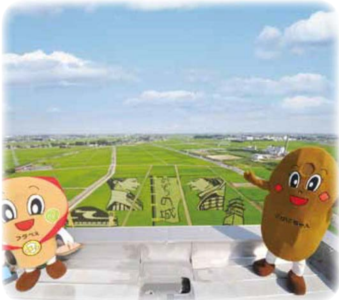
※施設管理者の許可を得て撮影しています。

このコーナーでは、行田の歴史や名所、名物などを行田ゼリーフライキャラクターのこぜにちゃんが分かりやすく紹介します。