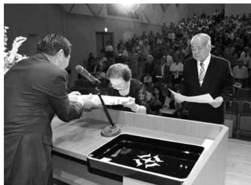
昨年の敬老祝賀式典の様子