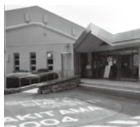
さきたま史跡の博物館