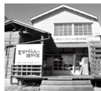
足袋とくらしの博物館