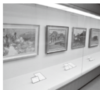
産業文化会館アートギャラリー