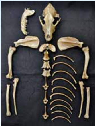
堀から見つかった犬の骨

ど、数点の長骨とみられていました。しかし、今年再調査した結果、少なくとも5〜6体分の犬の骨であること、推定体高(地面から背中までの高さ)が43〜48センチメートルと、現代の日本犬としては中型犬に近い体格であること、解体痕は当初の報告よりも多く、10カ所あることが分かりました。