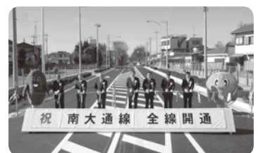
全線開通した南大通線

平成22年度の決算がまとまりました。決算は自治体の予算執行や財政運営を明らかにするもので、自治体の家計簿といえるものです。市民の皆さんからいただいた大切な税金などがどのくらい入り、どのように使われたのかを見てみましょう。