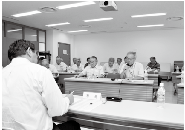
中央公民館で行われた第1回市政懇談会