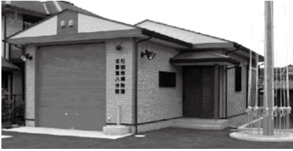
新築された北部第8分団庁舎