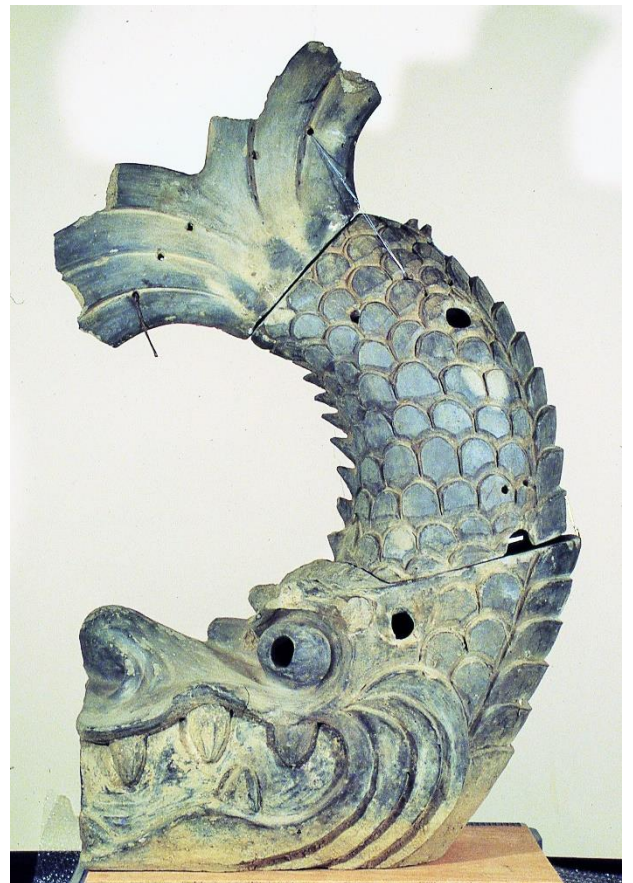
おしじょう しゃち 忍城の鯨

しろ しゃち うみ お城の鯨は、海にいるシャチのことでは なく、想像上の生き物です。「しゃちほこ」と もよばれ、たか や ね おお もん 高いやぐらの屋根や、大きな門の や ね か じ くち 屋根におかれました。火事になると口から みず い った しろ 水をはき出すという言い伝えがあり、お城を まも かんが しゃしん 守ってくれると考えられていました。写真 は、え どのじだい おしじょう や ね 江戸時代に忍城の屋根におかれてい しゃち た鯨です。