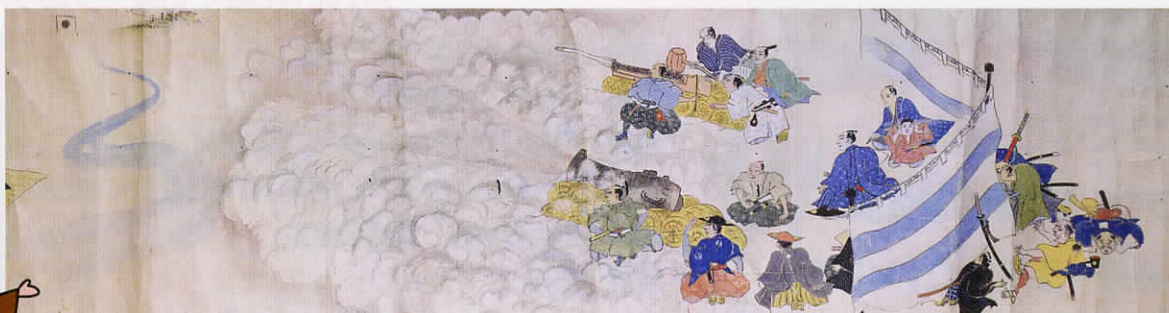
ほうじゆつつけいじょうず しき 「砲術形状図式」

てつぱう たいぱう う かつ まな おしはん し くんれん じょうず えが えまきもの 鉄砲や大砲の撃ち方を学ぶ忍藩士の訓練の様子が描かれた絵巻物です。