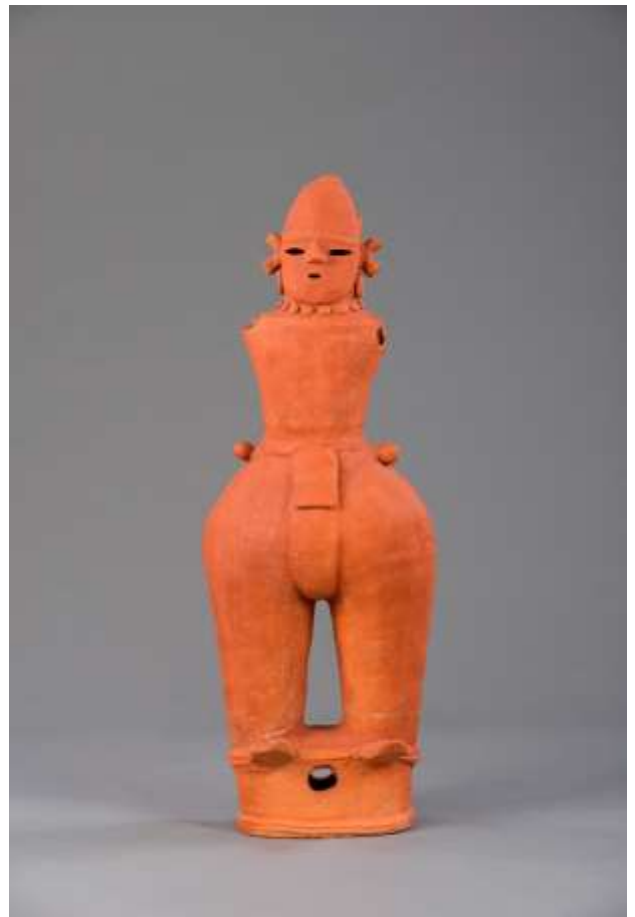
酒巻14号墳出土 力士の男子