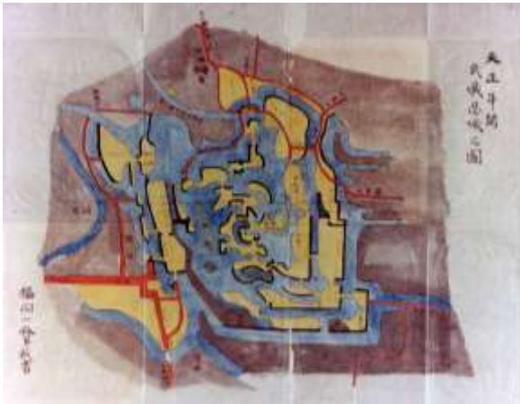
天正年間武蔵忍城之図