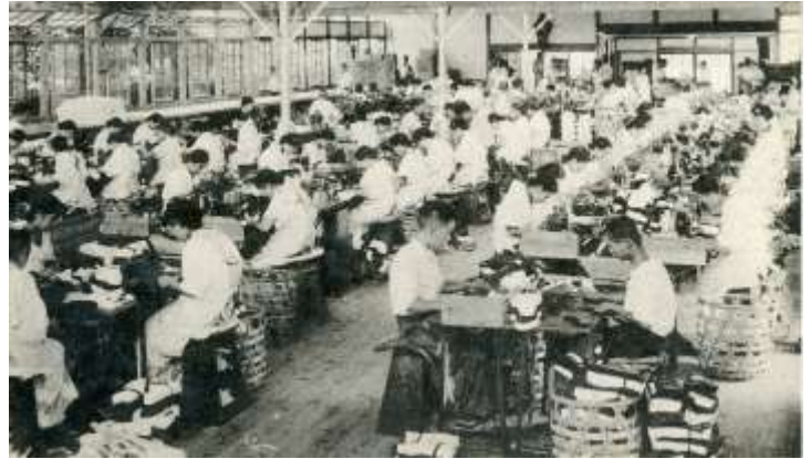
昭和初期の足袋工場（縫製）

この一覧は『行田市郷土博物館常設展示解説図録』（2014）掲載資料を元にした博物館内の展示資料一覧です。