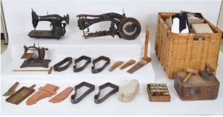
行田の足袋製造用具と製品