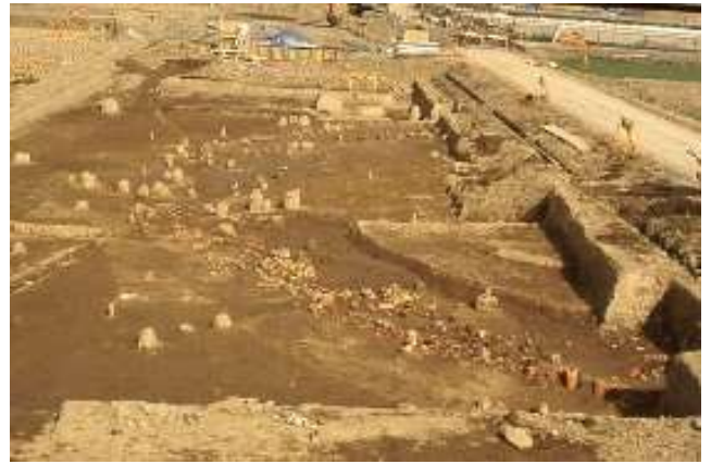
酒巻14号墳出土風景