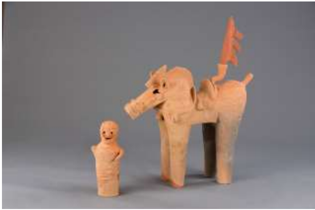
酒巻14号墳出土 旗を立てた馬