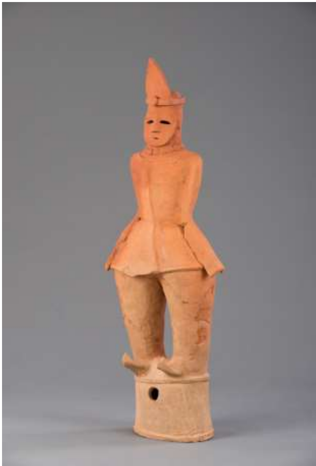
酒巻14号墳 筒袖の男子