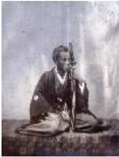
吉田庸徳ガラス湿板写真