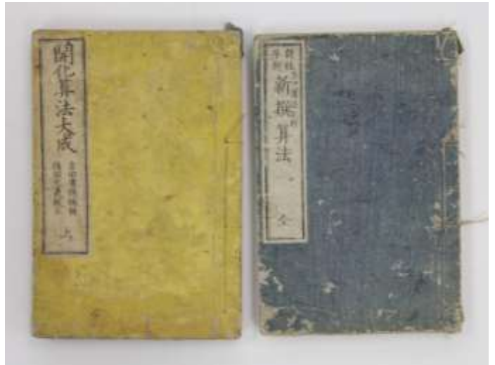
開化算法大成・新撰算法