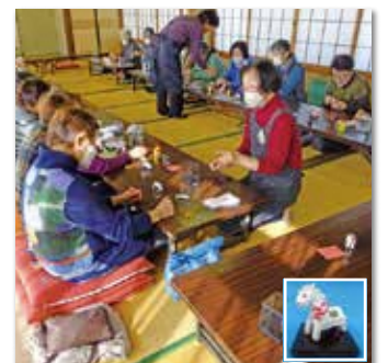
紙粘土で干支作り