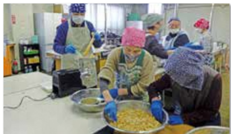
みそ作り講座(1回開催)