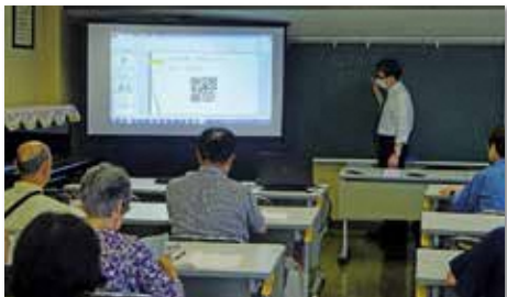
初心者スマホ講座(5回講座)