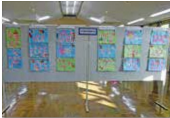
持田保育園園児作品