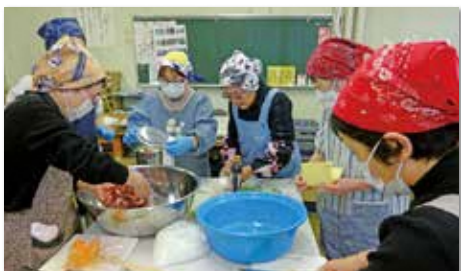
キムチのたれ作り講座(1回開催)