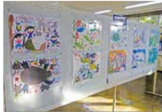
西小学校児童作品