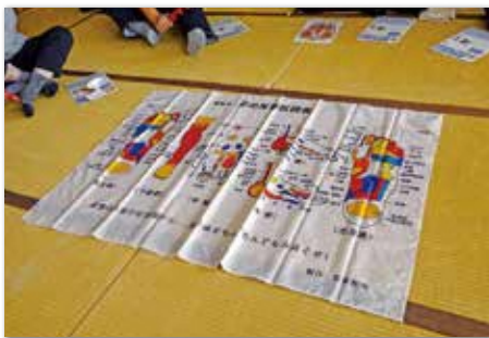
官足法体験(体調改善足モミ)