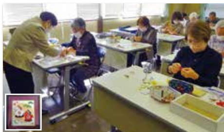
押し絵講座(2回開催)