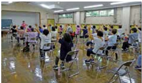
チェアエクササイズ講座(4回講座)