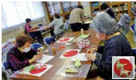
大人の折り紙講座(2回講座)