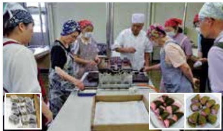
和菓子作り講座(2回講座)