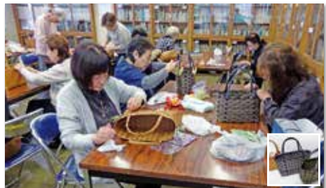
クラフトバンドバッグ講座(4回講座)