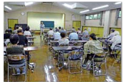
行田の自然と歴史