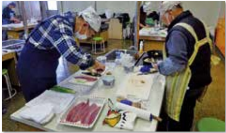
チャレンジ魚の身卸し講座(1回講座)