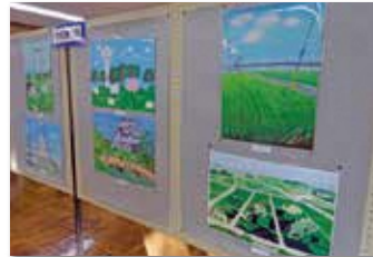
西中学校生徒作品