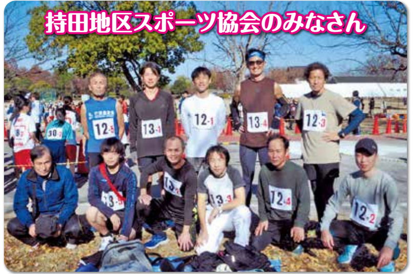
持田地区スポーツ協会のみなさん