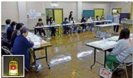
トルコガラス講座(1回講座)