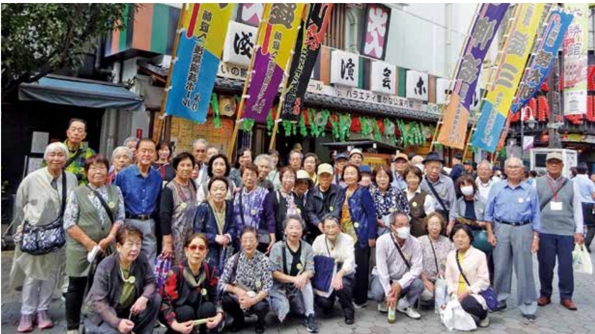
高齢者学級館外研修 令和7年10月7日