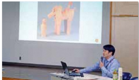
郷土史講座(3回講座)