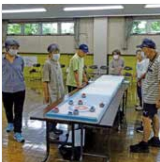
カーレット(卓上カーリング)