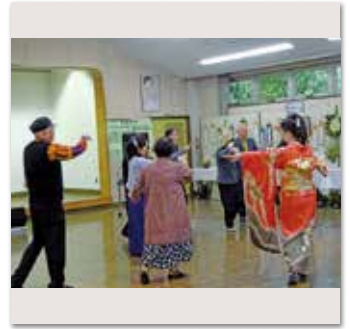
持田カラオケ愛好会