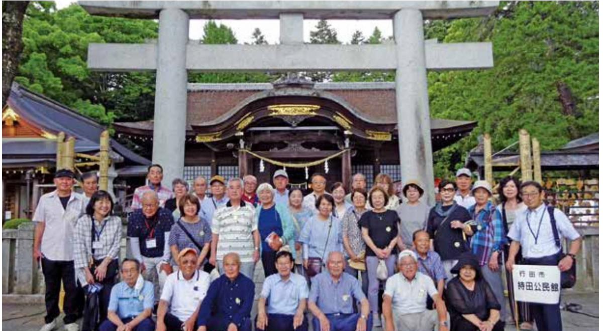
運営委員会館外研修 令和7年6月19日

発行:持田公民館 行田市城西5-9-26 TEL 048-553-1415 持田地区人口…13,057人 (男:6,503人 女:6,554人) 持田地区世帯数…6,140世帯 (令和8年1月1日現在)