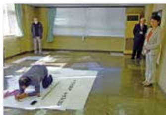
書道パフォーマンス