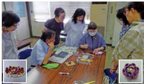
つまみ細工講座(2回講座)