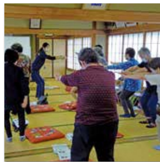
介護予防 ウォーキング教室