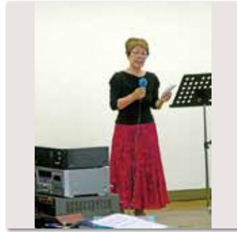
持田カラオケクラブ