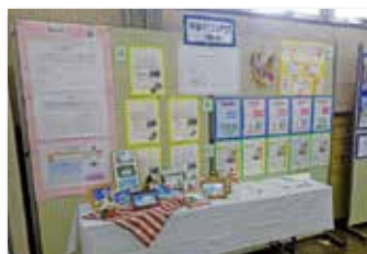
持田パソコンクラブ(土曜午前)