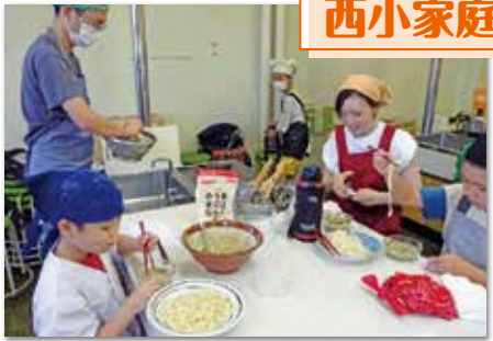
冷や汁うどん作り