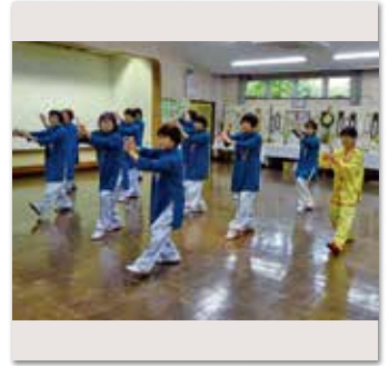
気功・太極拳クラブ