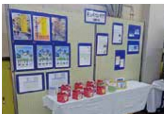
持田パソコンクラブ(金曜午後)