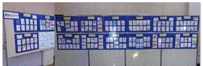
持田おたよりクラブ