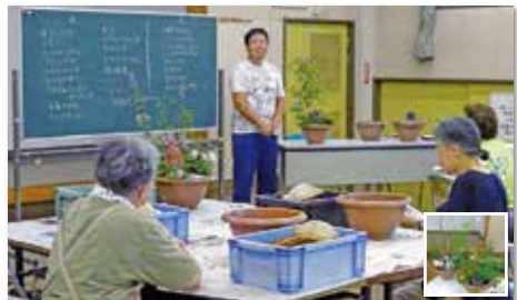
ガーデニング講座(4回講座)