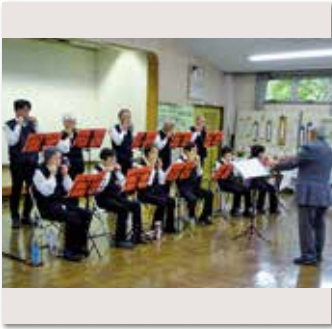
持田ハーモニカクラブ