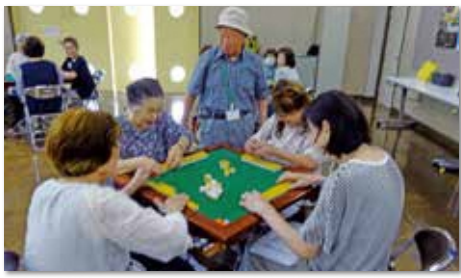
初心者健康マージャン講座(4回講座)