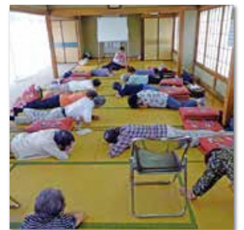
健康力を高めましょう