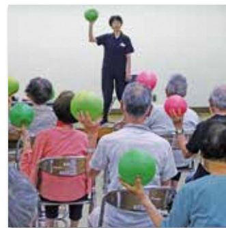
デュアルタスクトレーニング