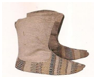
さし足袋(刺し子の足袋)

行田足袋については、「貞享年間亀屋某なる者専門に営業を創めたのに起こり」との伝承があり、享保年間(1716~1735)頃の「行田町絵図」に3軒の足袋屋が記されていることから、18世紀前半には生産が始まっていたと思われます。享保年間に忍藩主が藩士の婦女子に足袋づくりを奨励したとの伝説があるように、その後足袋づくりは盛んになり、明和2年(1765)の「東海木曾両道中懐宝図鑑」に「忍のさし足袋名産なり」と記されるまでに、広く知られるようになりました。足袋には株仲間がなく、取引が比較的自由に行えたことから、足袋づくりは益々盛んになり、天保年間(1830~1844)頃には27軒もの足袋屋が、行田のまちに軒を連ねるようになりました。