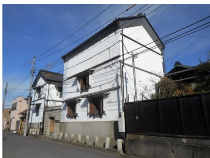
洋風建築技術が導入された大型の土蔵