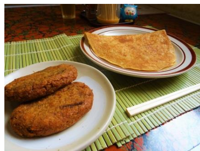
ゼリーフライ(左)とフライ(右)

こうして最盛期の昭和13～14年には、全国の約8割の足袋を生産する日本一の産地となり、『行田音頭』の歌詞に「足袋の行田を思い出す」とあるように、「足袋の行田か行田の足袋か」と謳われる“日本一の足袋のまち”になったのです。