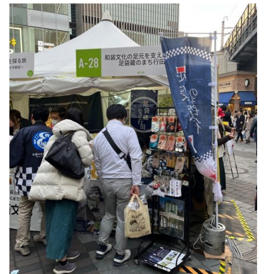
日本遺産マルシェの様子