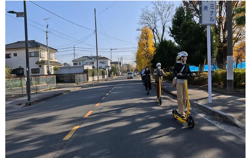
モニターツアーの様子