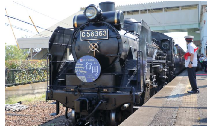
SLパレオエクスプレス特別運行