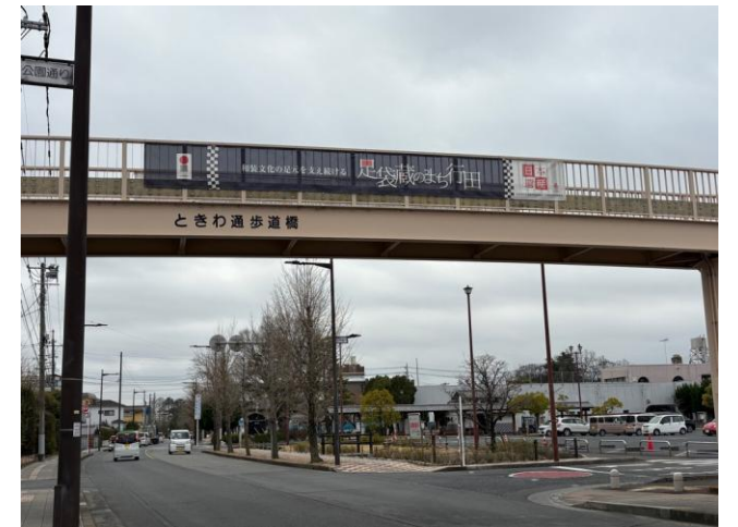
ときわ通歩道橋に設置した横断幕