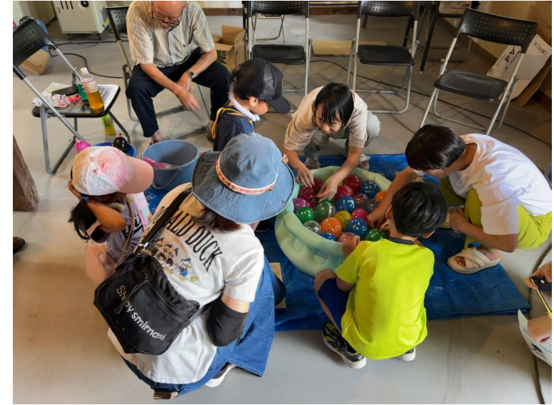
スタンプラリーの行田窯での様子