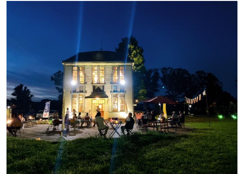
ビアガーデンの様子