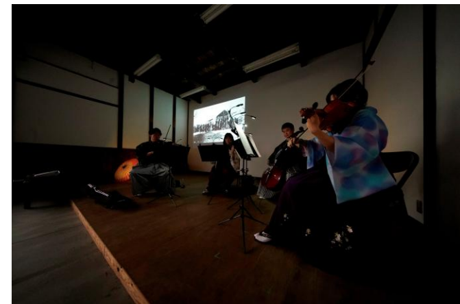
日本遺産コンサートの様子