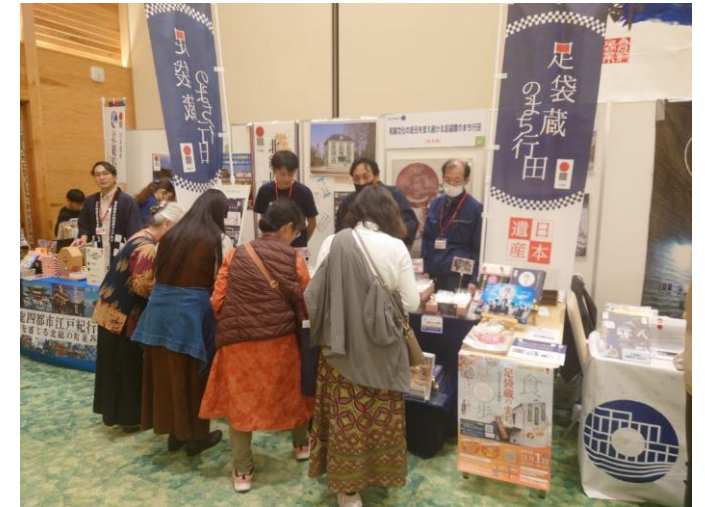
日本遺産フェスティバルの様子