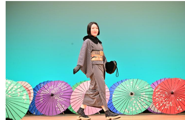
行田足袋コレクションの様子