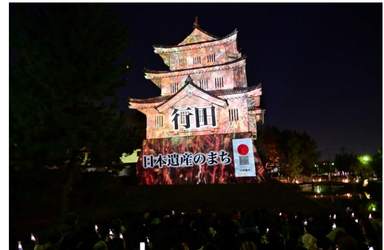
花手水タウン特別企画の様子