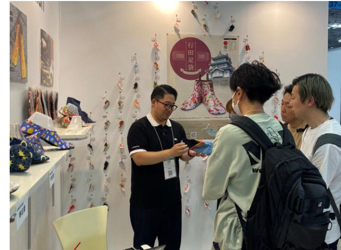
インバウンド向けグッズEXPOの様子