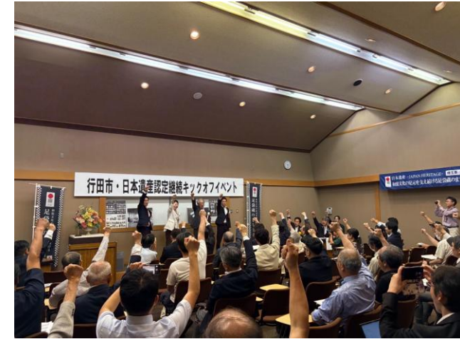
キックオフイベントの様子