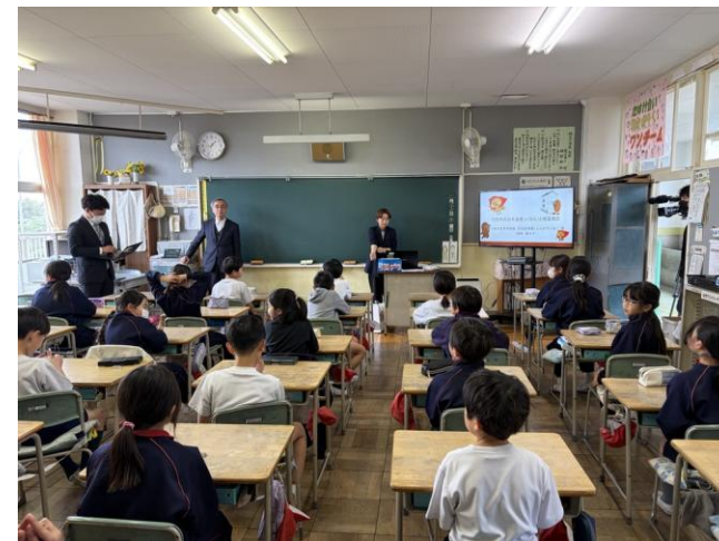
埼玉小での授業の様子