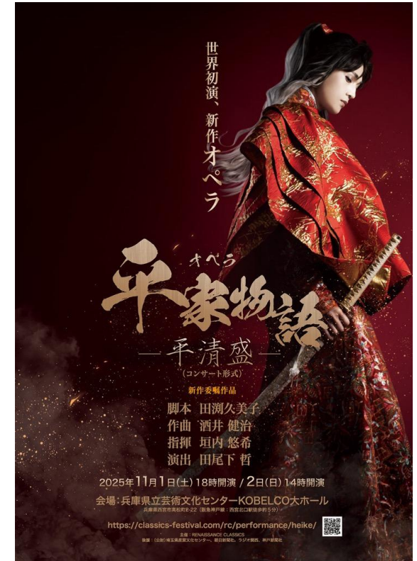
オペラ平家物語のポスター