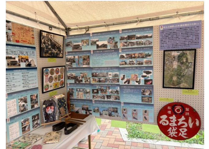
古墳フェスティバルでの展示の様子