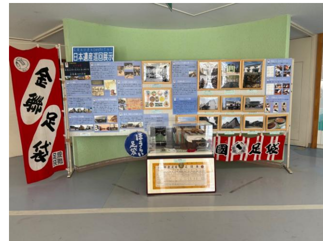
太田小での日本遺産展示の様子