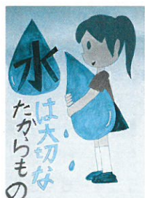
南小4年 筆 あずみ