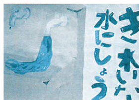
長野中3年 関 勝太