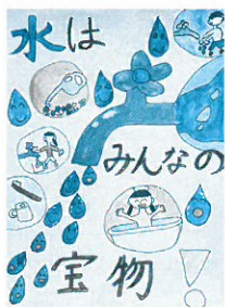
太田東小5年 蓮見 優