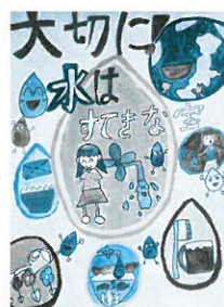
太田東小5年 坂井 純名