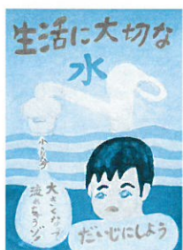
荒木小4年 野口 優心