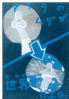
長野中2年 川崎 星南