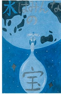
中央小4年 関根 希莉