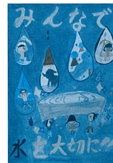
下忍小5年 竹越 真央