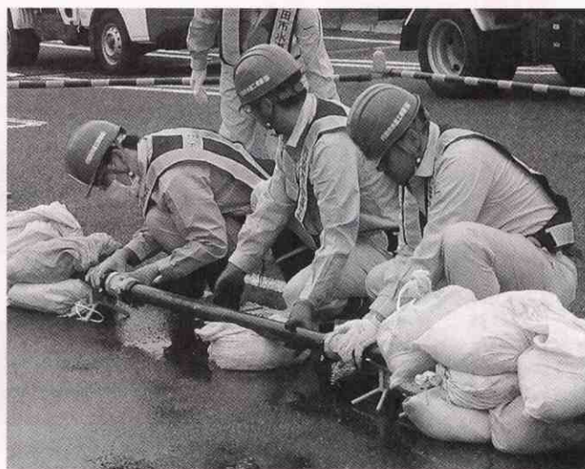
水道管復旧訓練作業

今年度もライフラインの確保に対応できるよう、水道管漏水に備えての模擬修理や、給水車による臨時給水、また緊急給水装置による街角給水を本番さながらに実施しました。