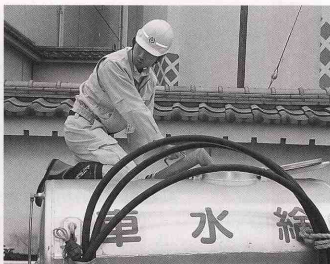
給水タンクへの注水作業