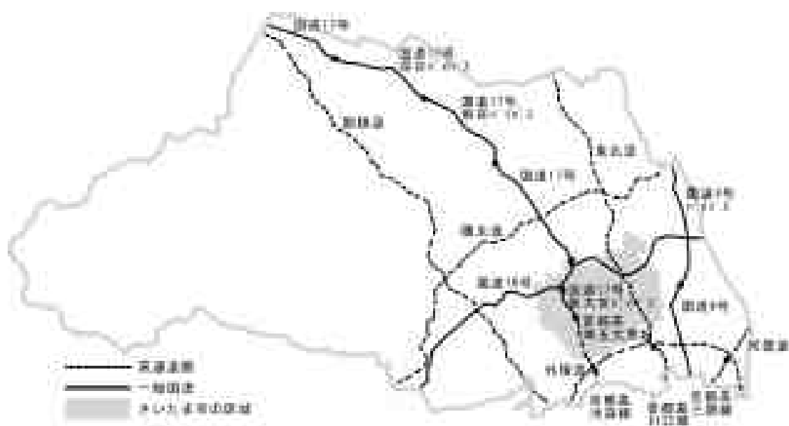
図2 九都県市による連携路線（県内）