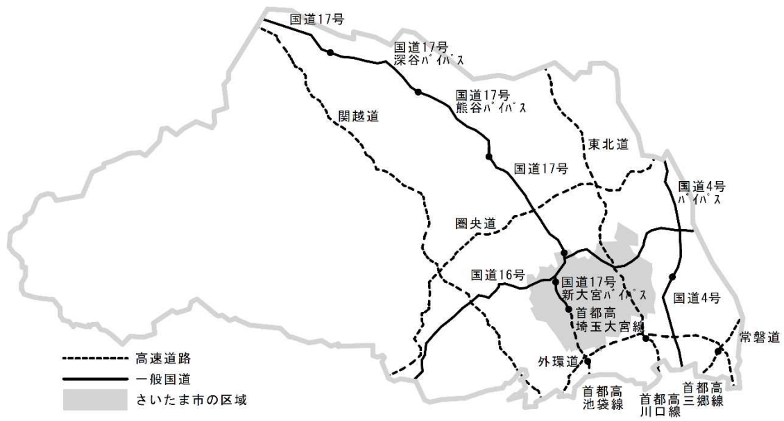
図2 九都県市による連携路線（県内）