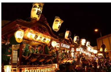
・天王様の祭りは、かつてだんべ祭りと同開催、現在は行田浮き城まつりとともに開催

行田八幡神社の催事としては、伝統的な天王様（八坂神社）の祭りがあります。また説明会で話題となった七夕飾りは昭和30年代に最盛期を迎えましたが、交通量増加に伴い飾れなくなり消滅しました。