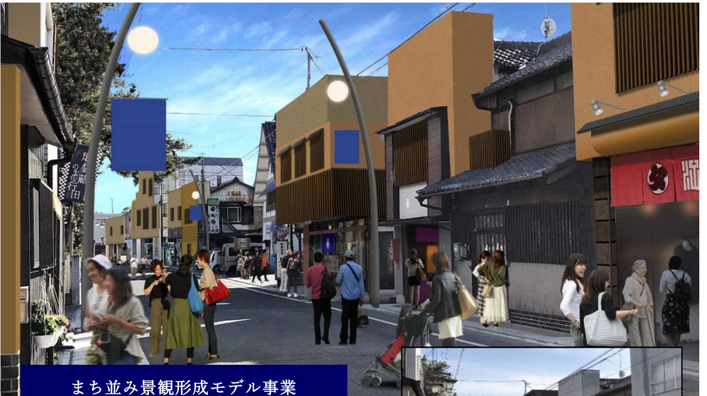
■イメージ2 大売出しの店付近