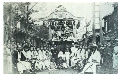
・明治43年の八幡町の山車。本町・新町・下町・八幡町で総町を形成して祭りを実施していた。