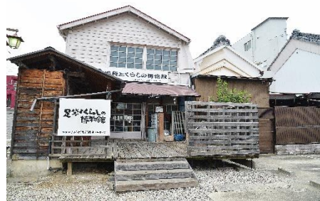
足袋とくらしの博物館