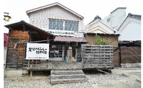
足袋とくらしの博物館