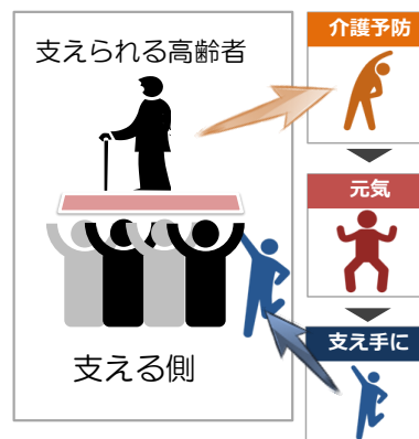
【図2：高齢者が支え手に】