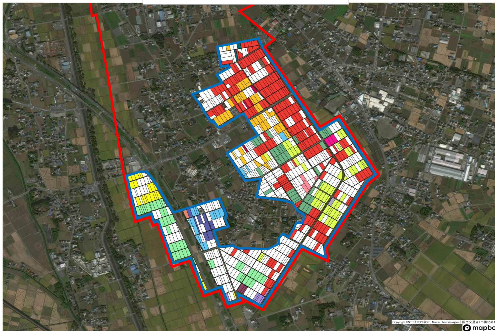
⑱ 渡柳・利田・埼玉地区 目標地図