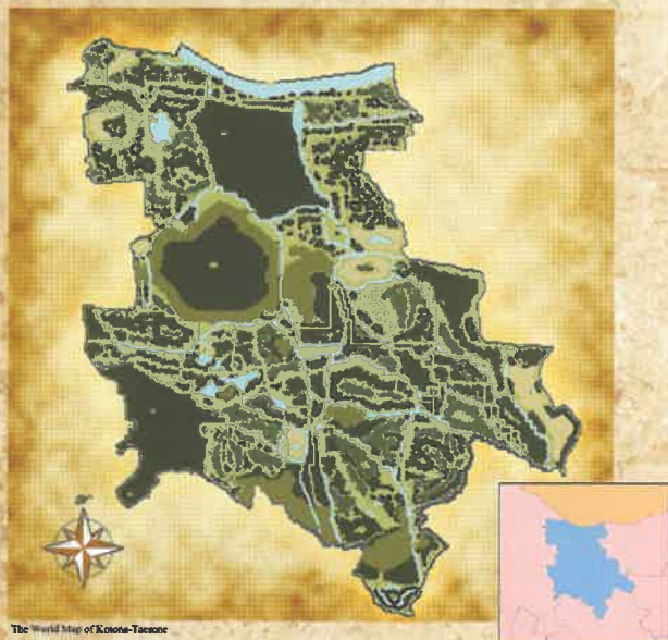
The World Map of Kotona-Taesone

Kotona-Taesone, The authentic Japanese RPG set in Gyoda City.