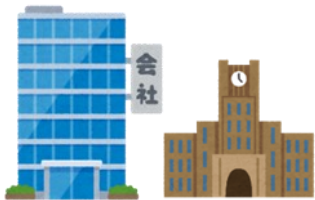
民間企業・教育機関等