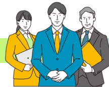
Co-Labo Gyoda (企画政策課内)