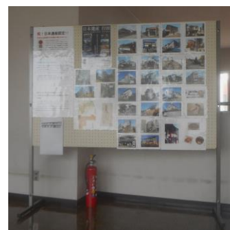
地域公民館での展示の様子