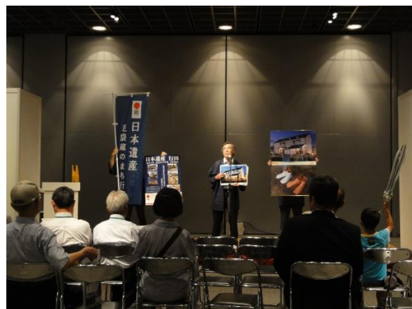
ホットPRステージの様子