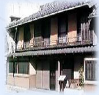
老朽化が進む歴史的建築物※

「歴史的建築物」とは、建築後、50年以上経過した工場、店舗及び事務所等の歴史的・文化的価値を有する外観的特徴を備えた建築物