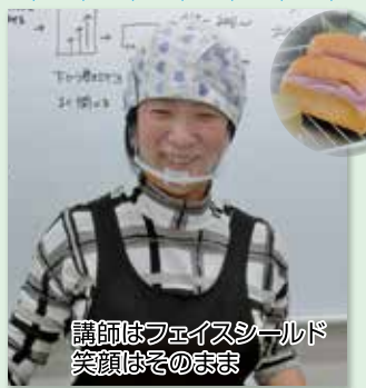
講師はフェイスシールド 笑顔はそのまま