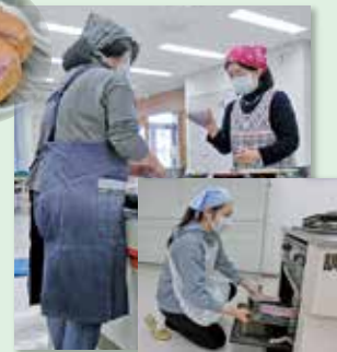
美味しいパンになあれ