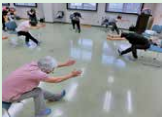
お互いの距離を守って