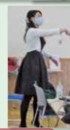
手洗い・消毒・マスク着用は必ず!