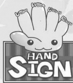
道路横断時の安全行動 イメージキャラクター 「サイン(SIGN)ちゃん」