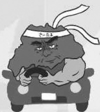
歩行者優先 イメージキャラクター 「さいたまお父さん」

※統一行動日とは、関係機関・関係団体が連携を図り、一斉に交通事故防止の啓発に努める日のことです。