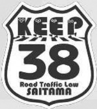
道路交通法第38条 「横断歩道における歩行者等の優先」