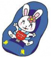
チャイルドシート着用推進シンボルマーク「カチャビヨン」