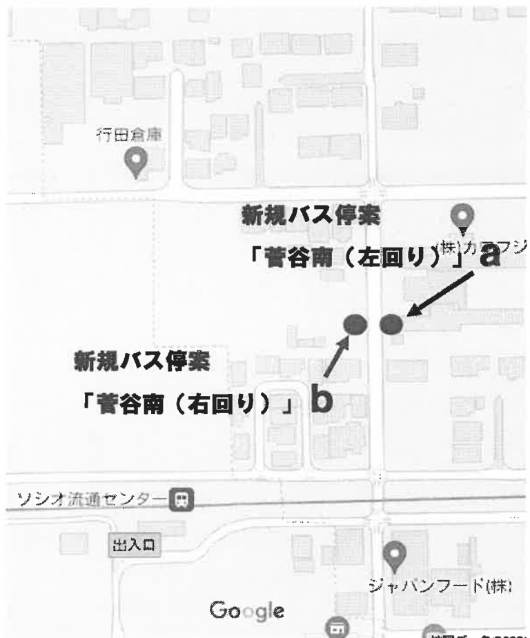
西循環コース 変更後バス停8 「菅谷南」