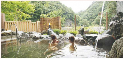
浜平温泉しおじの湯