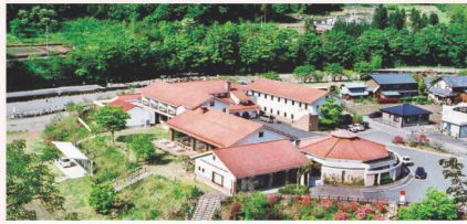
向屋温泉ヴィラセセラぎ