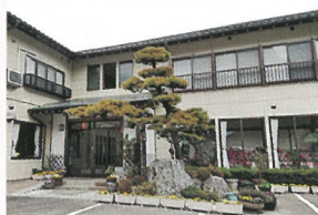
民宿旅館不二野家