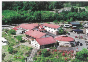
向屋温泉ヴィラせせらぎ