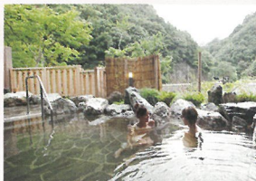
浜平温泉おじの湯