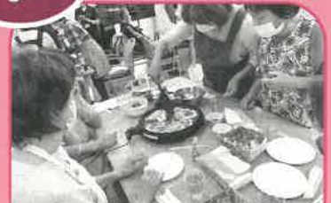
フライ作り inあずみ苑行田