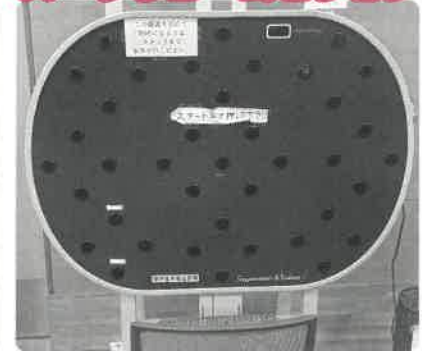
スープレュームビジョン