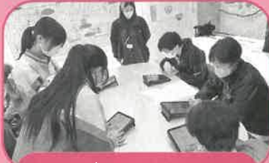
タブレット脳トレ