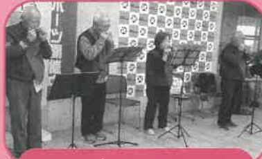
いきがいハーモニ