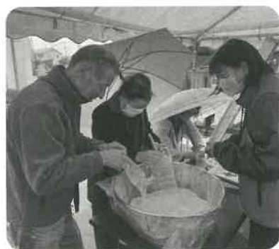
佐間地区自治会連合会 防災訓練