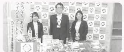
明治安田生命行田(営)様