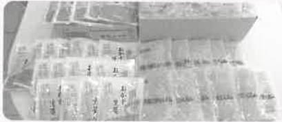
山本食品工業(株)様