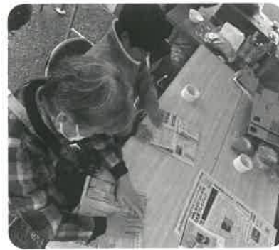
太井地区自治会連合会 防災啓発事業