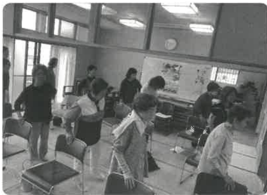
いきいきサロン活動