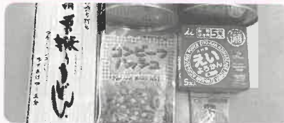
ファミリーマート 行田持田店様