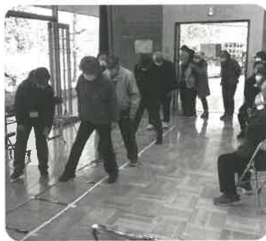
忍地区自治会連合会 健康推進事業