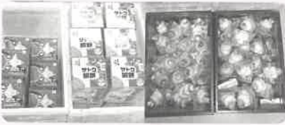
(株)ベルク 行田城西店様