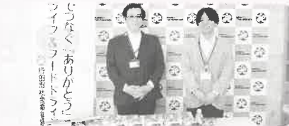
(株)ベイシア 行田店様