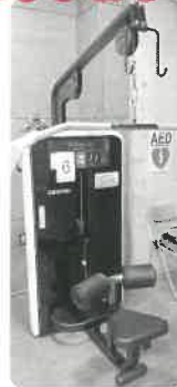
ラットプルダウン