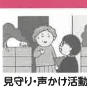
見守り・声かけ活動