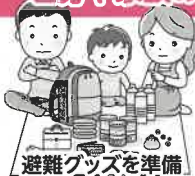
避難グッズを準備