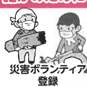
災害ボランティア登録