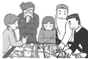
支えあいマップづくり