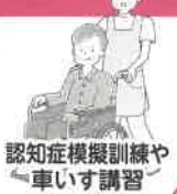
認知症模擬訓練や車いす講習