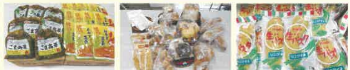
山本食品工業(株)様