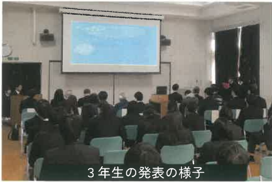
3年生の発表の様子

令和7年12月16日(火)の3・4限目に、3年生が行田學発表会を行いました。代表生徒が本校の産社室で発表し、その様子を1・2年生へオンラインで配信しました。