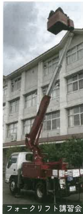
フォークリフト講習会