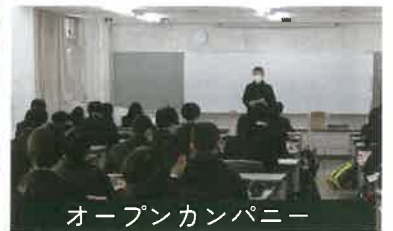
オープンカンパニー