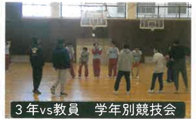
3年vs教員 学年別競技会