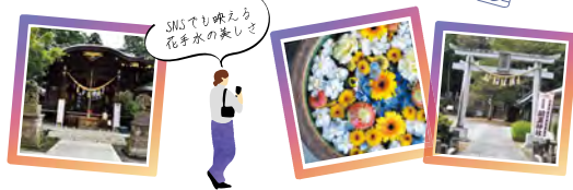
SNSで映える花手水の美しさ

開催時期 毎月1日~14日 ※11月と1月は15日~末日まで(8月はお休み) 会場 右ページのマップでご確認ください。