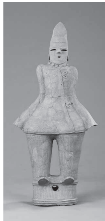
筒袖の男子人物埴輪(酒巻14号墳)