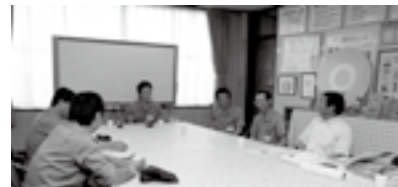
明和グラビア株式会社ではスポーツ施設についての意見などが出されました