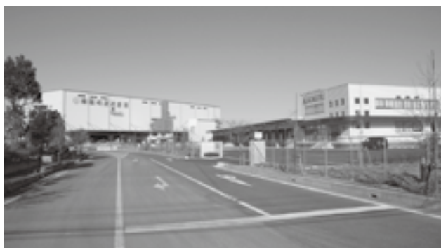
完了したスーパー街区には多くの企業が進出しました