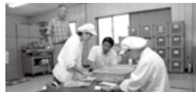
株式会社大徳商会では作業の様子も見せていただきました

従業員の皆さんと意見交換をしたり、会社の様子を拝見したりしました。この日訪問したのは、長野1丁目の「株式会社大徳商会」と富士見町1丁目の「明和グラビア株式会社行田工場」です。意見交換では、「観光に力をいれ、多くの人に行田を訪れてもらえるようにしてはどうか」や「スポーツに親しむ機会を増やすため、施設の利用方法を検討してはどうか」といった意見が出されました。市では、寄せられた意見について、できるものから市政に反映させていきたいと考えています。