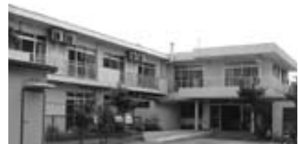
ショートステイ事業を行うケヤキホーム

2歳以上の児童で、保護者が疾病などの理由により家庭における児童の養育が困難になった場合に、児童養護施設などで児童を一時的にお預かりします。