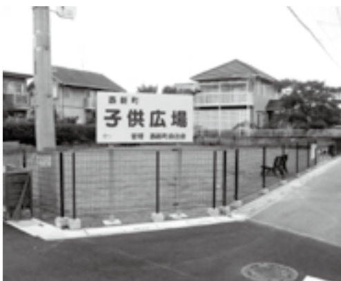
新しく整備された子供広場