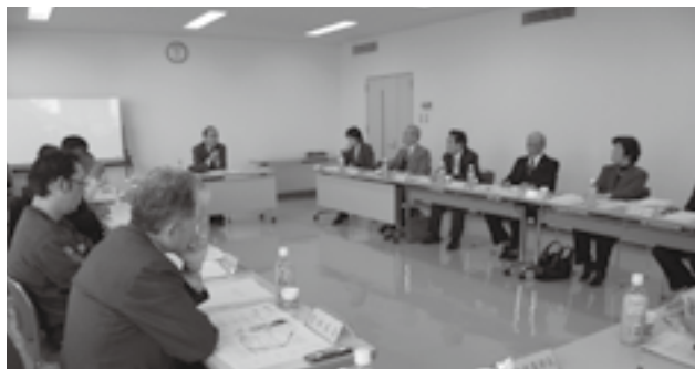
行政改革推進委員会では活発な意見交換が行われました