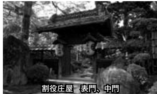
割役庄屋 表門、中門