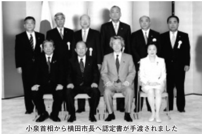
小泉首相から横田市長へ認定書が手渡されました