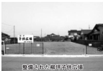
整備された柳坪子供広場

①1日に保育する乳幼児が5人以下の施設 ②事業所内保育施設 ③店舗などにおいて商品の販売または役務の提供を行う間に限り、その顧客の乳幼児を保育するために設置する施設 ④親族間の預かり合い(設置者の四親等内の親族を対象) ⑤半年を限度として臨時に設置される施設 ▶問い合わせ 子育て支援課(内線263)