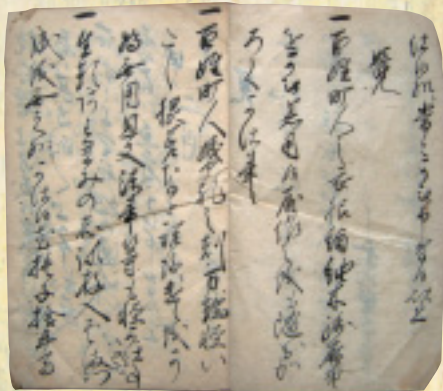
御法度書 元禄17年 (1704年)

事の禁止、田畑永代売買の禁止、宗門改の徹底などが35カ条にわたり記されています。中里村名主加藤家文書の「御法度書」は元禄17年(1704)2月に出された幕府の法度が忍藩から村人に伝えられたもので、内容は百姓・町人の衣類、婚礼・法事・祭礼の簡素化をはじめ、生活全般にわたり奢侈 しやうし を禁じています。また「生類あわれみの志いよいよ存じ入り…」とあるように、有名な「生類憐れみの令」も記載されています。最後に村人から確認の証文を取ることとなり、中里村百姓47人の署名と印判が押してあることから、確実に村中に伝えられたことが分かります。