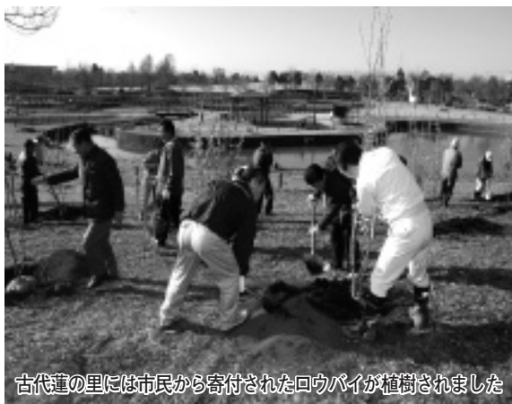
古代蓮の里には市民から寄付されたロウバイが植樹されました

↓いただいたご提案を受け、ロウバイの植樹に協力いただける方を募集し、昨年12月に寄付してくださった方々によってロウバイの植樹が行われました。市では、古代蓮の里を四季折々の花が楽しめる公園にしていく計画です。