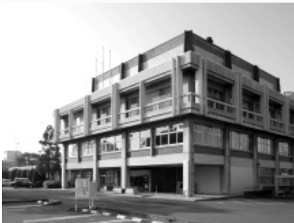
市では新しい視点に立った改革に取り組んでいます

市では、今後における厳しい財政状況下でも安定した行財政運営を行うために、「行政改革推進本部」や、公募市民や有識者により編成された「行政改革推進委員会」を設置し議論を重ねてまいりました。