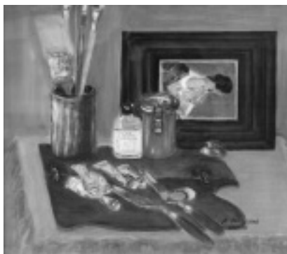
『絵画用品』(油彩画) 松竹 支 (持田)