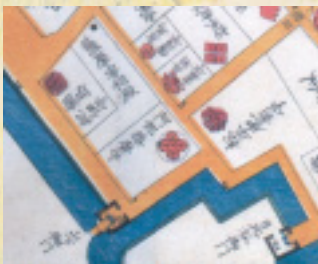
阿部家上屋敷 （嘉永3年『麹町永田町外 桜田絵図』より）

阿部家の上屋敷の場所は和田倉門内から何度か移転していますが、江戸時代の前半について