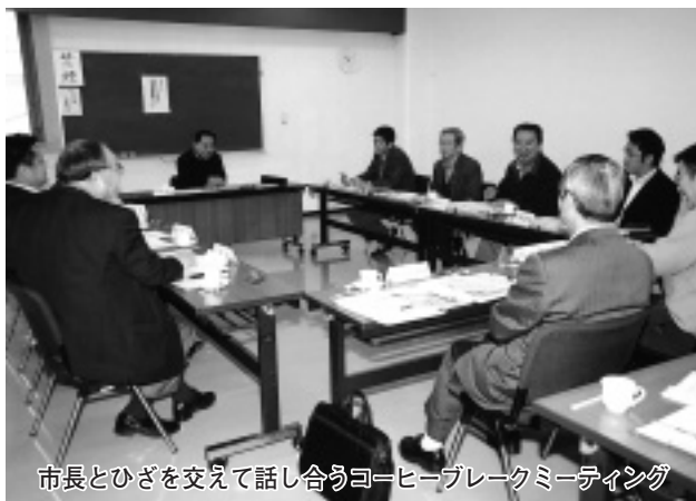
市長とひざを交えて話し合うコーヒープレークミーティング

グです。毎回、あらかじめ定めたテーマに基づいて自由に発言していただき、その中からまちづくりのヒントを見つけるこの取り組みは、市長と気軽に親しく話ができる機会として好評です。