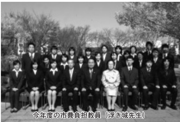
今年度の市費負担教員（浮き城先生）