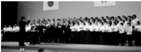
オープニングはベートーベンの「第9」の合唱でスタート