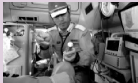
気管挿管訓練を行う堀救急救命士