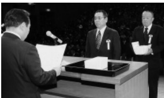
合併に貢献された方に感謝状を贈りました

1月1日に南河原村と合併し新「行田市」がスタートしたことを祝い、1月14日に、国、県をはじめ近隣市町長ら行政関係の来賓や市民約850人が出席する中、産業文化会館において合併記念式典が開催されました。