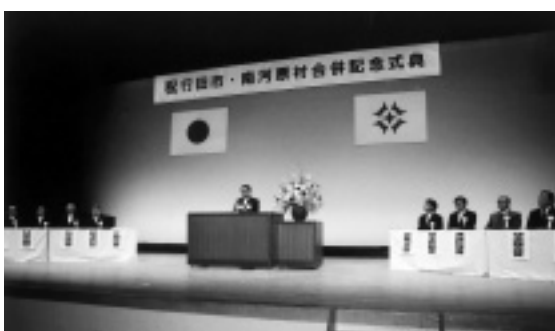
多くの参加者を前に式辞を述べる横田市長