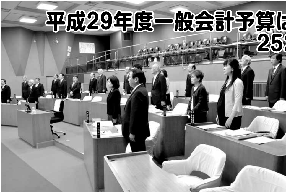
議場風景(3月定例会)

3月定例会には、市長提出議案37件が提出され、すべての案件を原案のとおり同意・可決しました。主な議案の内容は次のとおりです。