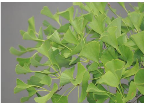
市の木・イチョウ