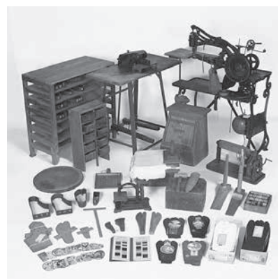
行田の足袋製造用具及び関係資料(抜粋) (行田市郷土博物館所蔵)