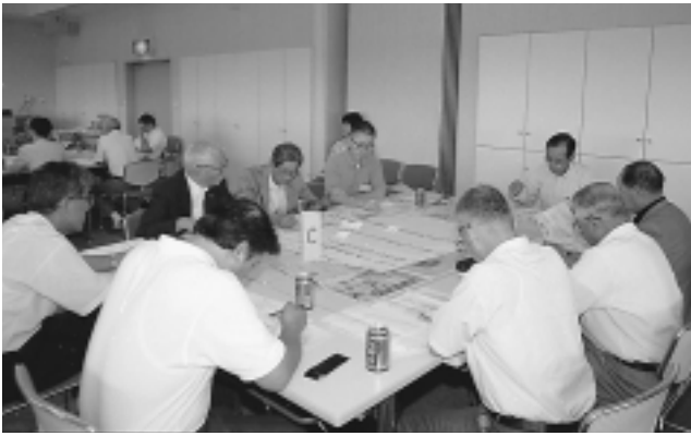
昨年の「まちづくりふれあいトーク」